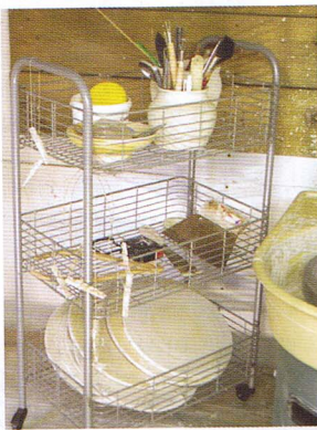
zie tip 6