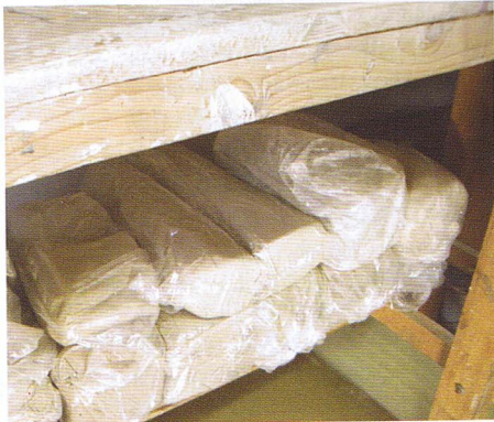
zie tip 11